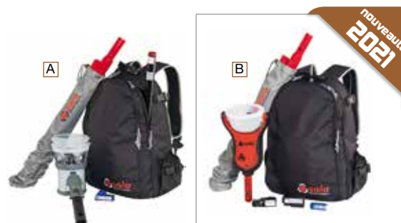
Urban Kit, léger, pratique, compact.